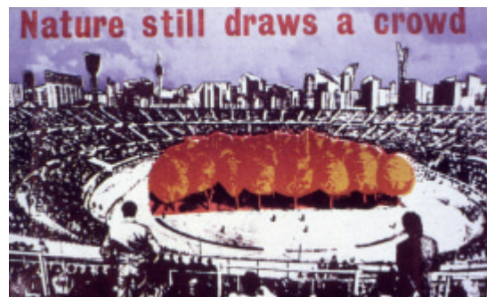
Links: Jamie Reid, Untitled (2012)