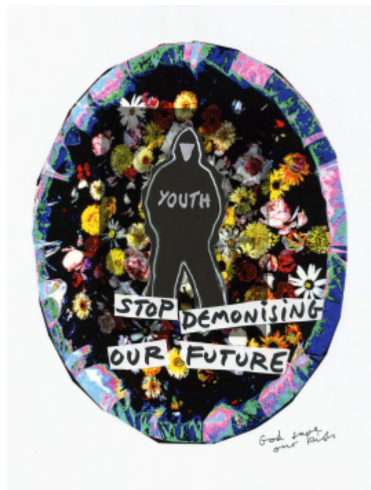
Links: Jamie Reid, Free Pussy Riot (2012)