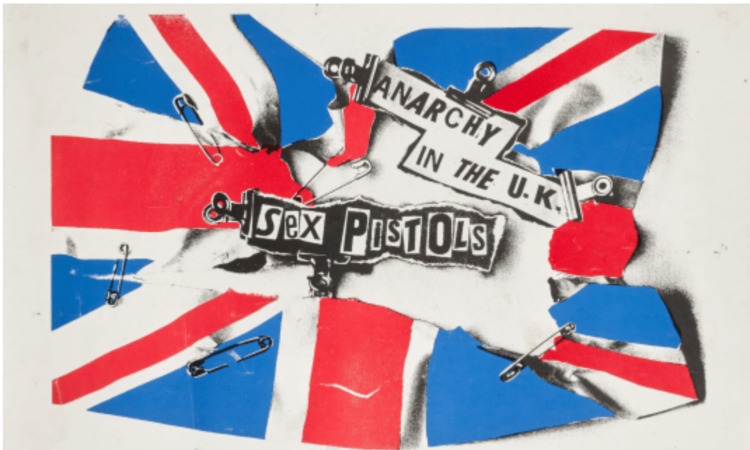
Jamie Reid, Anarchy Flag on Diagonal (1976)

Design Museum Den Bosch presenteert vanaf 27 juni 2026 de eerste tentoonstelling over Jamie Reid (1947-2023) in Nederland. De Britse kunstenaar, ontwerper en activist is wereldwijd bekend om zijn vormgeving voor de iconische platenhoes Never Mind the Bollocks, Here's the Sex Pistols (1977). Maar de ontwerpen uit de gloriejaren van de punk vormen slechts een klein deel van Reids oeuvre. De tentoonstelling laat zeer uiteenlopend werk zien: van activistische zines en anarchistische collages uit de jaren zeventig tot films, ruimtelijke installaties en mystieke schilderijen uit de jaren daarna.