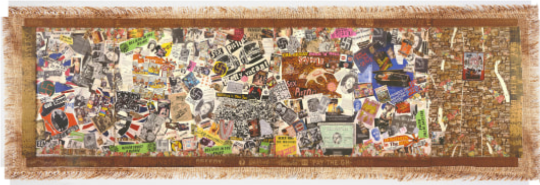
Jamie Reid, Sex Pistols Mural (1979-1984)