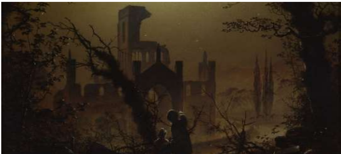
William J. Boot, "When Evening Twilight Gathers Round", 1877.

Het ontwerp van de tentoonstelling wordt verzorgd door Bureau Lakenvelder. De ondertitel Designing Darkness is het uitgangspunt van het ontwerp: een spel van licht en duisternis, waarin de schaduw de boventoon voert. Normaliter zijn tentoonstellingszalen overzichtelijke bakens van licht en helderheid, hier zorgen de donkere wanden die schuin in de zaal geplaatst zijn en de schaarse belichting voor een mysterieuze, duistere sfeer die perfect past bij de inhoud van GOTH – Designing Darkness . Twee audiotours leiden de bezoeker door de ruimte: er is een keuze tussen een meer traditionele tour en een tour die is ingesproken door de populaire pop-noir zangeres Lakshmi (bekend van Wie is de Mol ), waarin muziek en geluidseffecten het verhaal van de tentoonstelling versterken. Duurzaamheid is een belangrijke overweging geweest in het ontwerpproces: de sokkels bestaan uit kratten die gebruikt worden voor de versterking van dijken: ze worden na de tentoonstelling gewoon weer voor hun oorspronkelijke doel ingezet.