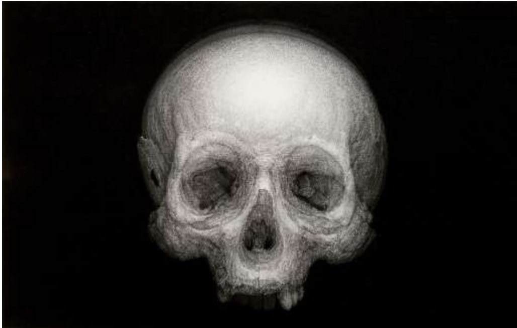
Cindy Wright, "Eye to Eye (unification)", 2020. Eigendom stad Antwerpen, in langdurige bruikleen in M HKA. C/o Pictoright 2021.