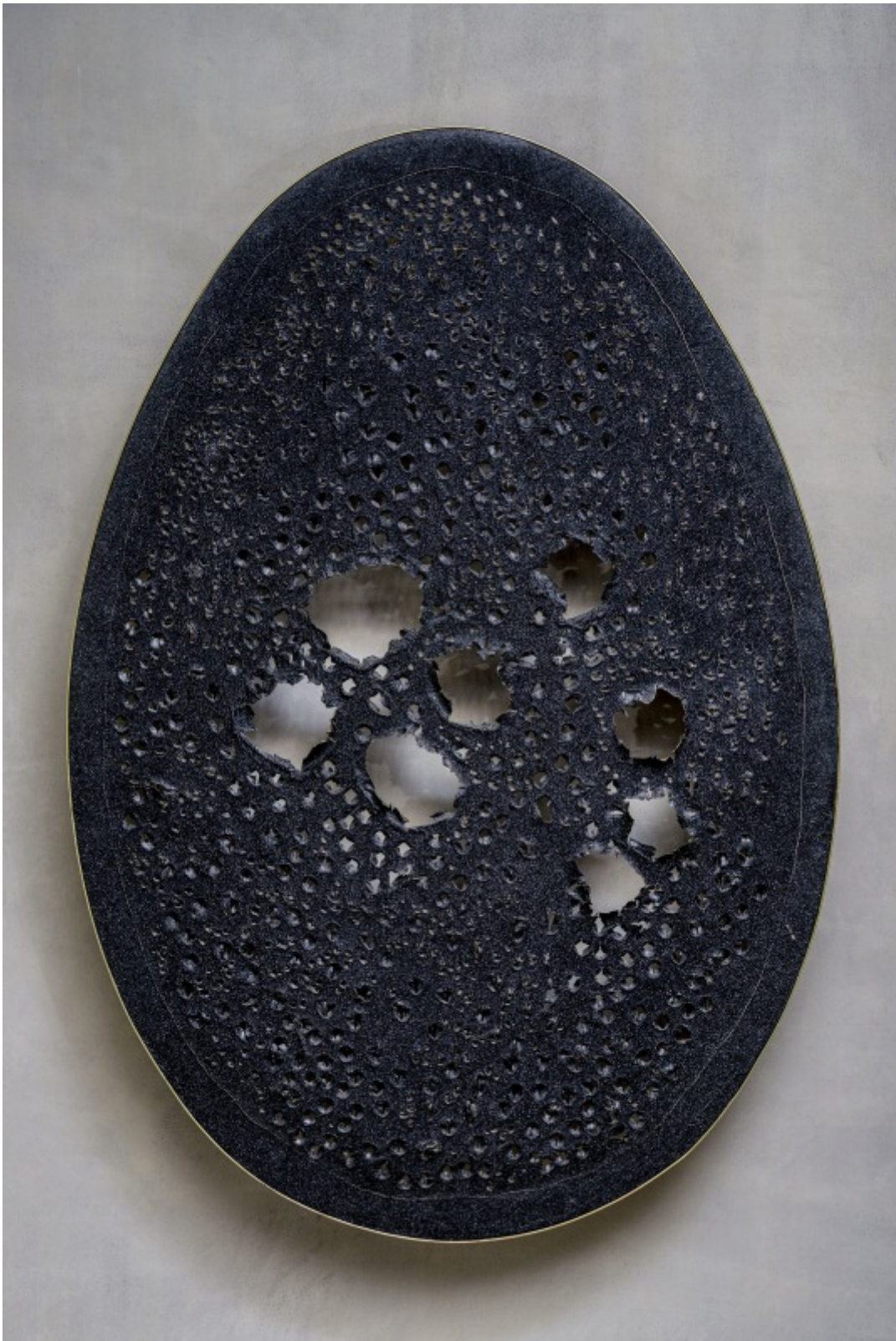
Lucio Fontana, 'La fine di Dio, Concetto spaziale', 1963. Collectie Wildkust, Wassenaar