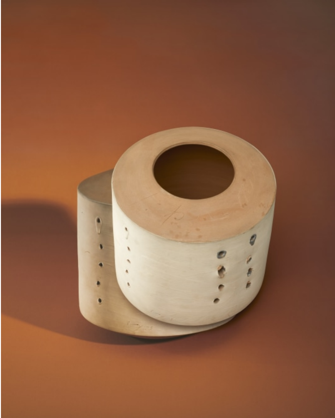
Lucio Fontana, 'Concetto spaziale', ca. 1985. Collectie Design Museum Den Bosch. Fotografie Blommers/Schumm, 2021

verovering van de ruimte in een tijdperk waarin de mensheid de kosmische ruimte betrad.