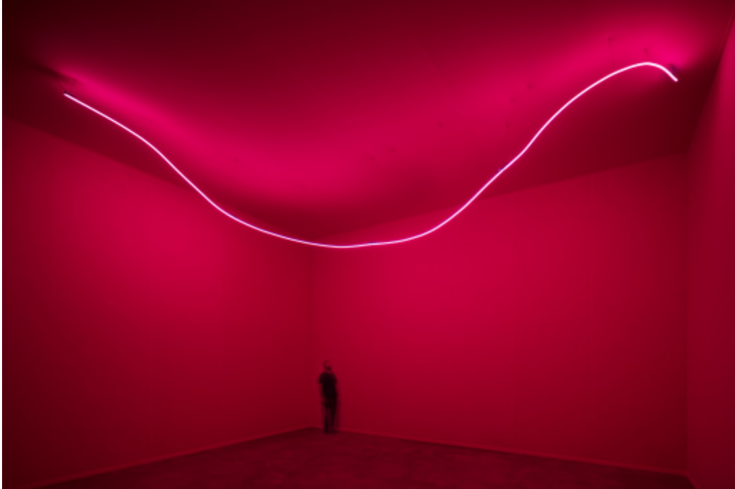
Lucio Fontana, 'Ambiente spaziale con neon', 1967/2017, installatie in de Pirelli HangarBicocca, Milan, 2017. Oorspronkelijk gerealiseerd voor Stedelijk Museum, Amsterdam, 1967. Foto Agostino Osio © Fondazione Lucio Fontana, Milano, SIAE/ PICTORIGHT 2021 Gereconstrueerd in Design Museum Den Bosch

vormgeving, sculptuur schilder- en tekenkunst. Fontana gebruikte hierbij nieuwe technische vindingen als fluorescerende verf, blacklight en neonlicht. De Ambienti zijn driedimensionale schilderijen, ruimtelijke tekeningen of sculpturale architectuur. Fontana maakte geen principiële onderscheid tussen de verschillende beeldende disciplines. In tegendeel: hij trachtte ze te verenigen in al zijn werk. Hij pleitte zo voor een kunst die zich, door gebruik te maken van alle nieuwe mogelijkheden, kon verhouden tot de moderne tijd. Voor het eerst sinds 1967 zijn deze ruimtelijke installaties weer in Nederland te zien.