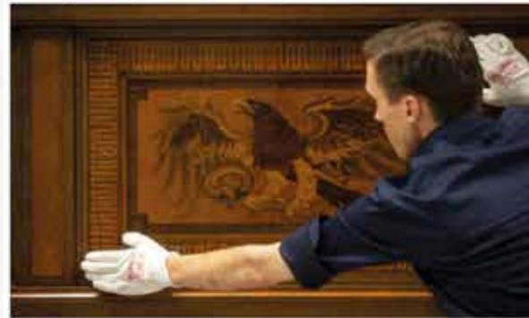
A sculpture of Adolf Hitler goes on display at Den Bosch's Design Museum.

An exhibition of Nazi design has opened in the Netherlands to protests and a request for visitors to the museum not to take and share photographs for fear of the exhibits being glorified on social media.