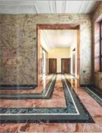
Casa Corbelli, van Pina Porri, ingetrokken tot het nazi-derde Rijk.

"Ben je een slecht mens als je sommige nazidesignobjecten echt mooi vindt? Dat niet"