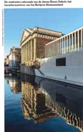
De architectuur van Casa Corbelli, het laatste ontwerp van het Derde Rijk.

Ongeduld met reïfisme uit de fascistische periode is dagelijks te zien in Duitsland, waar het erfgoed nog heel tastbaar is. Na de oorlog is de wettelijke verandering van de architectuur niet altijd door de gebouwen, maar de overgebleven gebouwen krijgen steeds meer een heiligschuldige aanblik. Een mooi voorbeeld is Tempelhof, de luchthaven die de naoorlogse heraanpak van de stad is. Het is een mooi voorbeeld van de naoorlogse heraanpak van de stad.