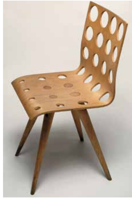
Gijs Bakker, prototype Stoel met gaten no. 2