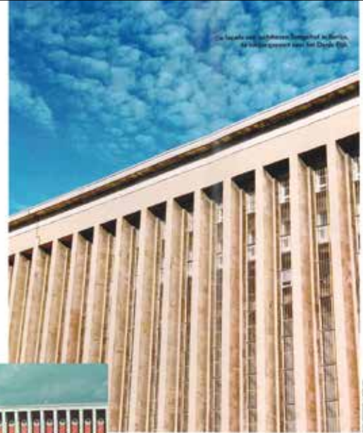
De laatste van het Duitse Reichstag in Berlijn, de huidige parlementsgebouw van het Derde Rijk.