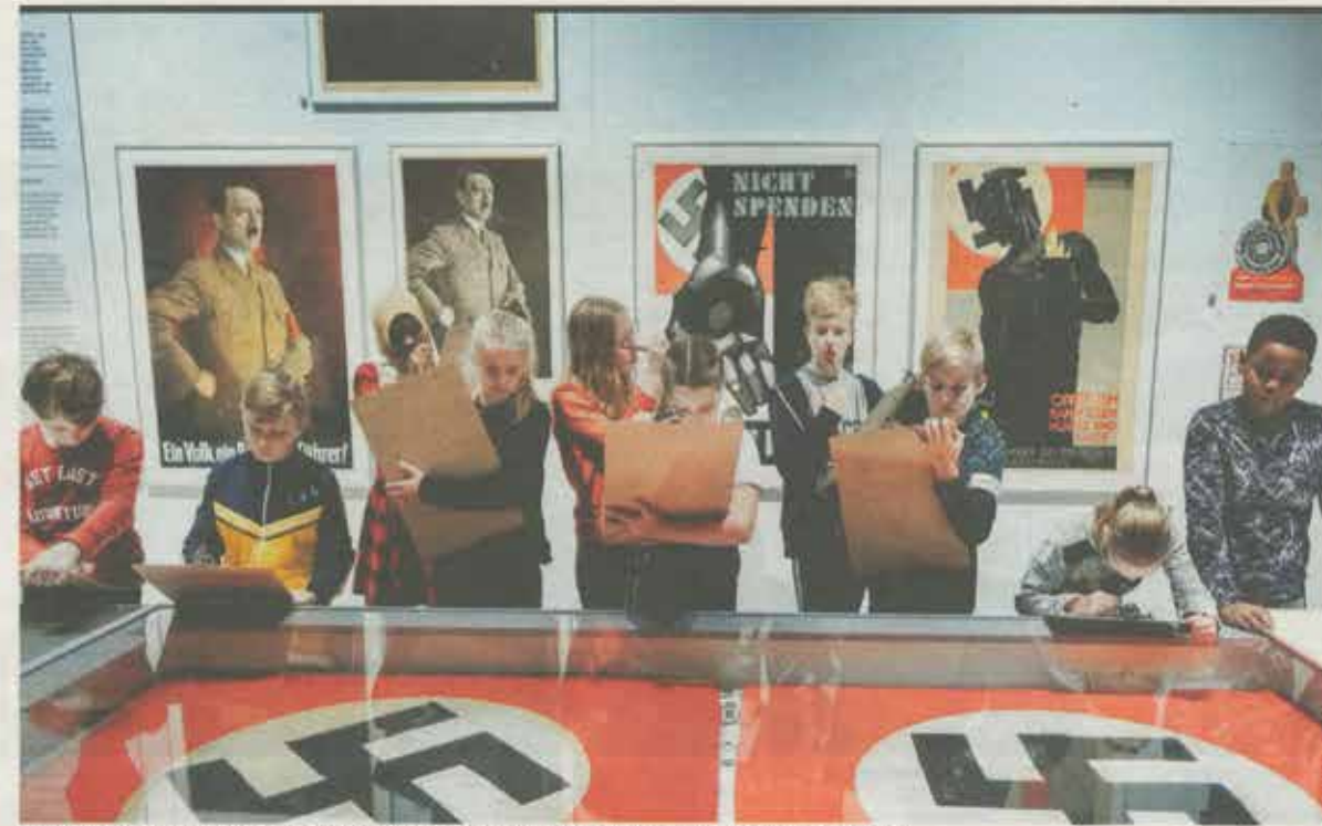
Groep 8 van basisschool 't Talent uit Schijndel bezoekt de expositie Design van het Derde Rijk in het Design Museum.