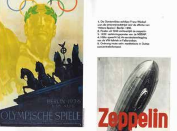
1. De Oostenrijkse architect Franz Hofstätter ontwierp de tentoonstelling voor de affiche van 'Hitlers Sport' (1936). 2. Poster uit 1933 over het nazi-derde Rijk. 3. 1933 verkiezingsposter van de NSDAP. 4. 1938 affiche bij de wereldtentoonstelling van de WVR tebrak in Brussel. 5. Ordeboek voor de nazi-derde Rijk.

machines onder Hitler. "Stooid en gretig om te zijn, om te zijn, om te zijn." Dit is een vraag die niet alleen de kunstenaar, maar ook de consument moet stellen. Het is een vraag die niet alleen de kunstenaar, maar ook de consument moet stellen.