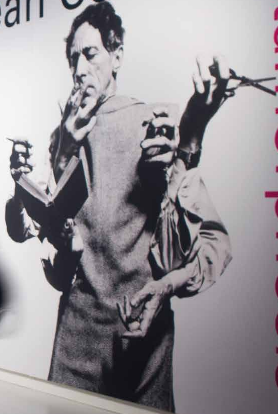
Jean Cocteau | metamorphosis