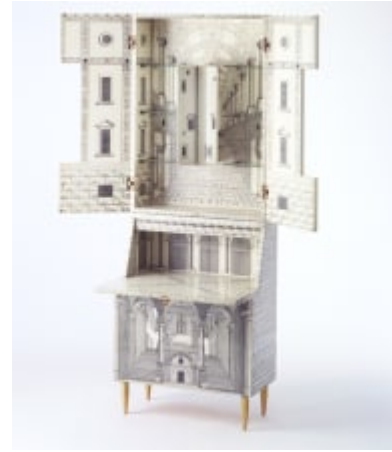
Links: zonder titel (bank), Studio 65, 1970. Rechts: Trumeau Architettura, Piero Fornasetti & Gio Ponti, 1951.