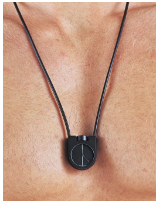
Rechts: Horloge ontworpen door Bruno Ninaber van Eyben, 1976. Collectie Design Museum Den Bosch.