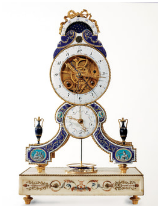
Links: Skeletklok met decimale wijzerplaat uit de Franse Revolutie, ca.1793-1795

Hoe meten we de tijd, en vooral: hoe geven we haar vorm? Wat betekent het eigenlijk om productief te zijn, of om het maximale uit je dag te halen? De tentoonstelling Alle tijd van de wereld zet de tijd even stil, om haar eens van dichtbij te kunnen bekijken. Ze verkent de verhalen achter de historische en moderne klokken, kalenders en andere tijdmeters die onze moderne wereld vormgegeven hebben.