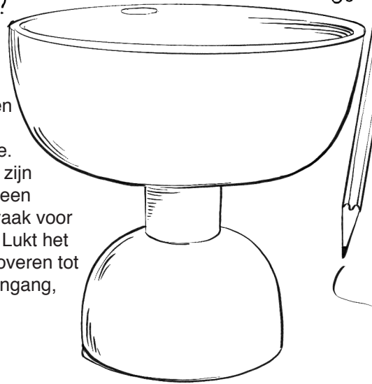
(Ettore Sottsass, 1991)

Ettore Sottsass was een ware vormenjager: hij zocht altijd naar de mooiste vormen en kleuren en stapelde er de meest bijzondere ontwerpen mee. Deze ontwerpen waren in zijn fantasie veel meer dan alleen vazen. Zo stelde hij zich vaak voor dat het gebouwen waren. Lukt het jou om deze vaas om te toveren tot een gebouw? Teken een ingang, ramen en bewoners!