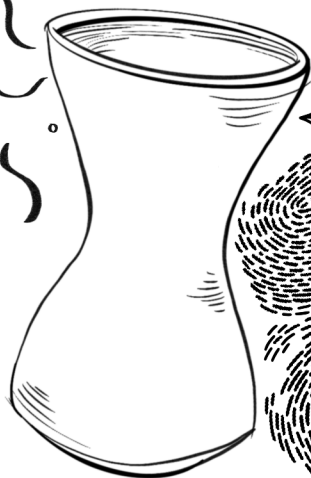
(Hans Coper, 1957)