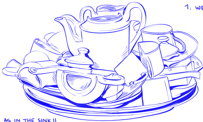
AS IN THE SINK II (Arman, 1990)

Ga op zoek naar dit ontwerp, gevonden? Kijk dan, voor jezelf, een tijdje goed naar alles wat je ziet. Praat nog even niet met elkaar, probeer alle details zo goed mogelijk te bekijken. Klaar met kijken? probeer dan samen 10 dingen op te noemen die je hebt gezien. Gelukt? Noem er dan samen nog eens 10, we weten zeker dat het jullie lukt!